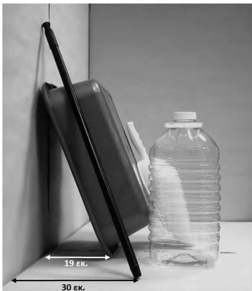
τέταρτη φωτογραφία: πλάγια όψη