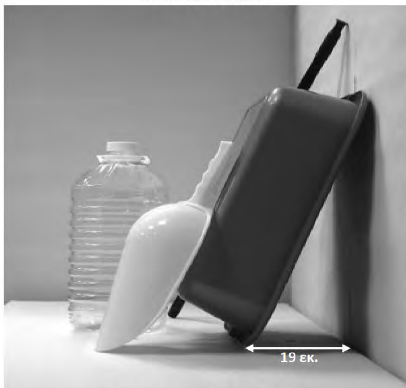
τρίτη φωτογραφία: πλάγια όψη