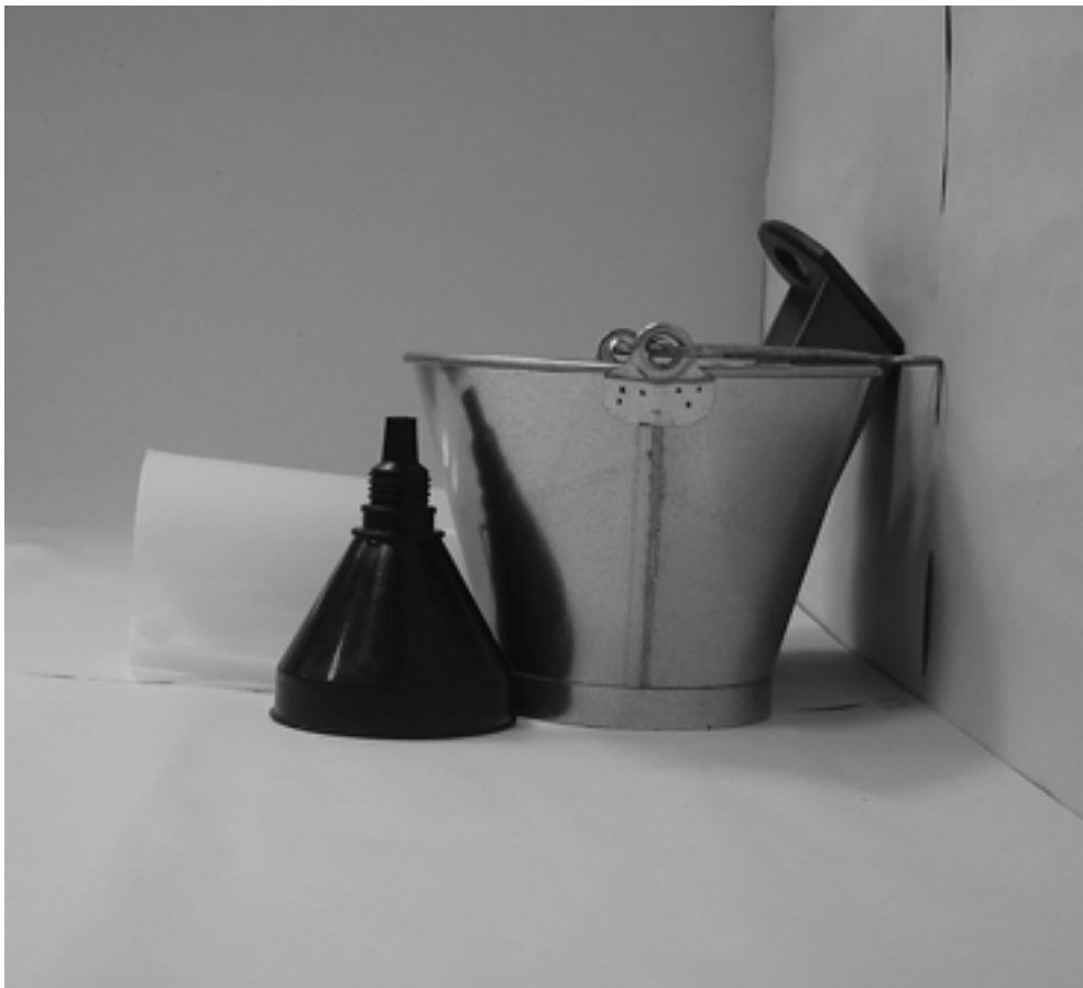
τέταρτη φωτογραφία: πλάγια όψη