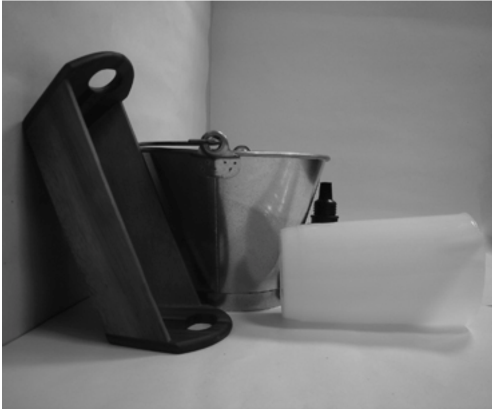
τρίτη φωτογραφία: πλάγια όψη