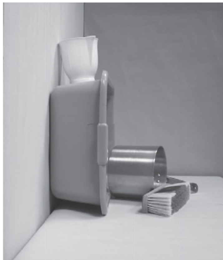
τέταρτη φωτογραφία: πλάγια όψη