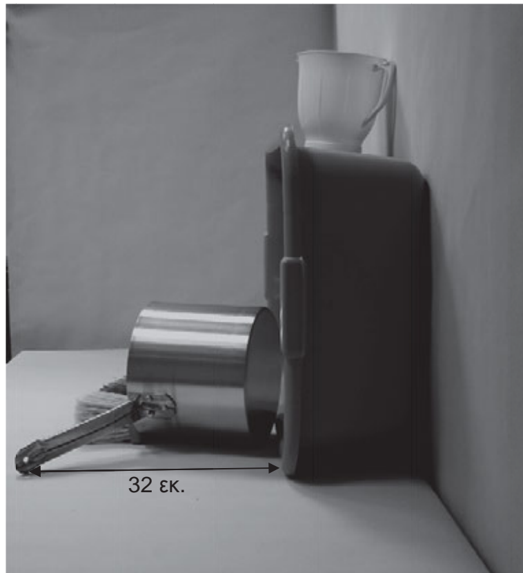
τρίτη φωτογραφία: πλάγια όψη