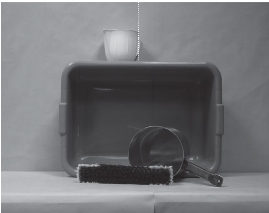
πρώτη φωτογραφία: μπροστινή όψη