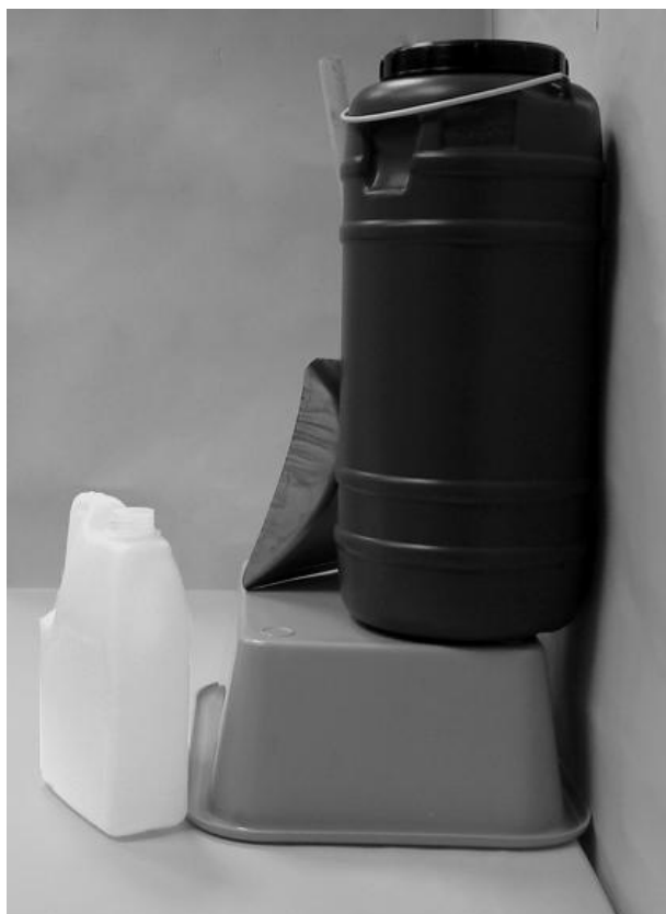
Τρίτη φωτογραφία: Πλάγια όψη