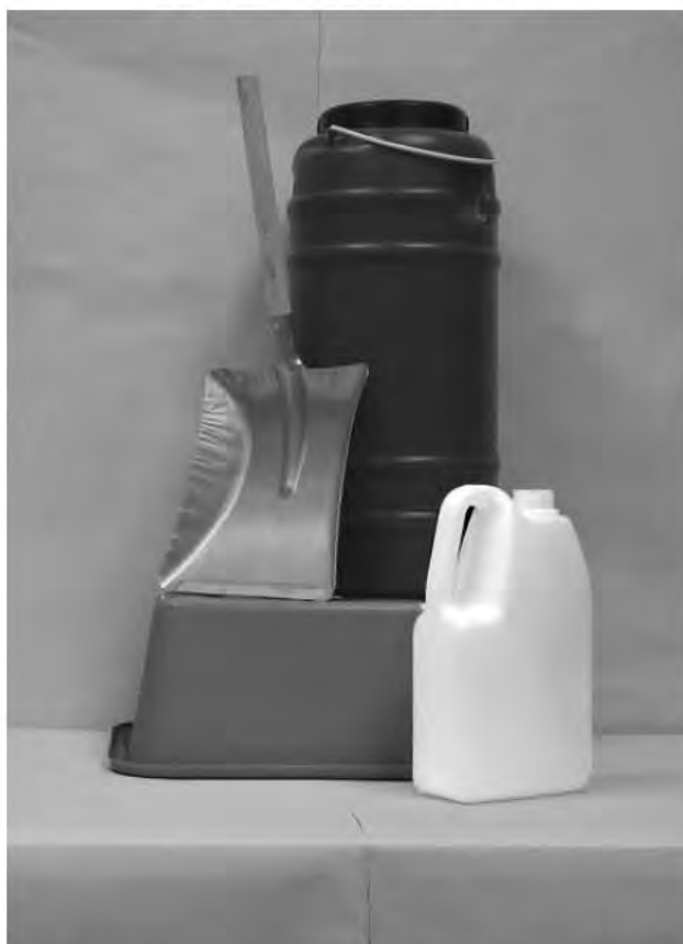
Πρώτη φωτογραφία: Μπροστινή όψη