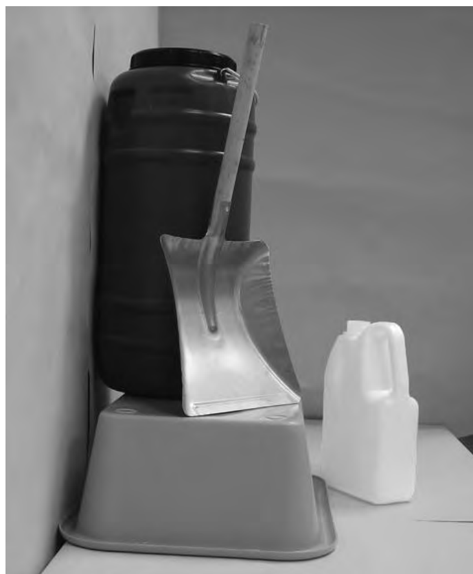
Τέταρτη φωτογραφία: Πλάγια όψη