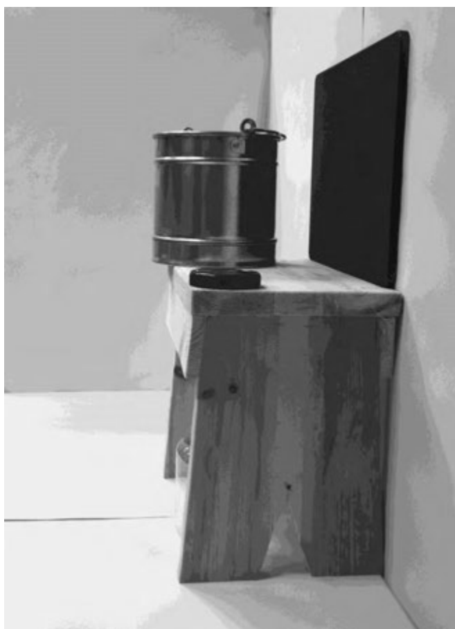
τέταρτη φωτογραφία: πλάγια όψη 2