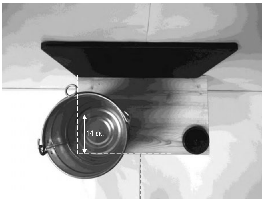
δεύτερη φωτογραφία: κάτοψη