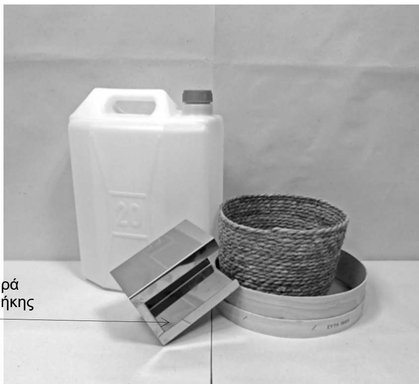
πρώτη φωτογραφία: μπροστινή όψη