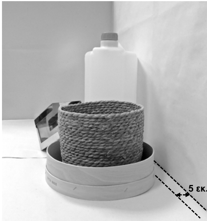
τρίτη φωτογραφία: πλάγια όψη 1