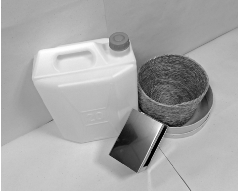
πέμπτη φωτογραφία: άποψη υπό γωνία