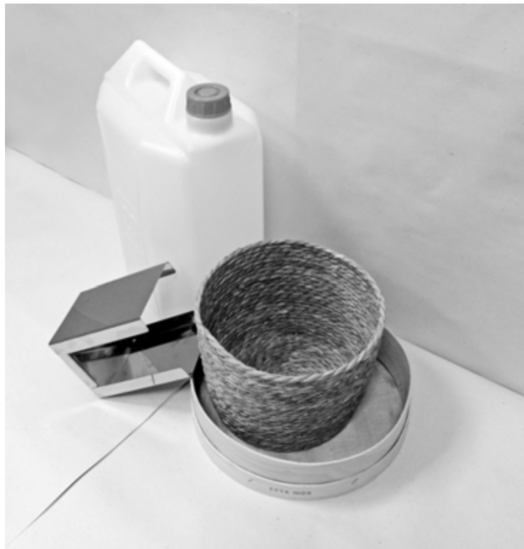
έκτη φωτογραφία: άποψη υπό γωνία