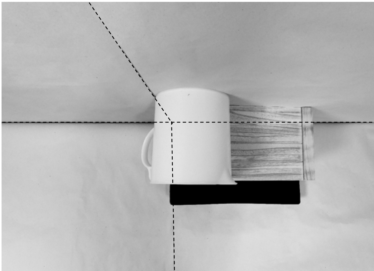
δεύτερη φωτογραφία: κάτοψη