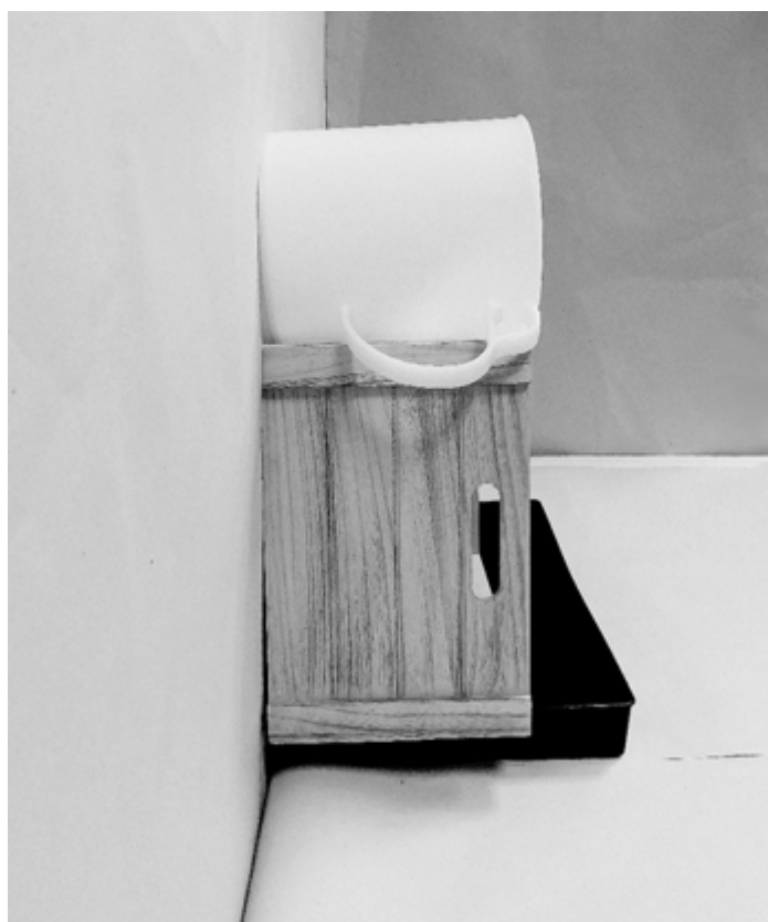
τρίτη φωτογραφία: πλάγια όψη 1