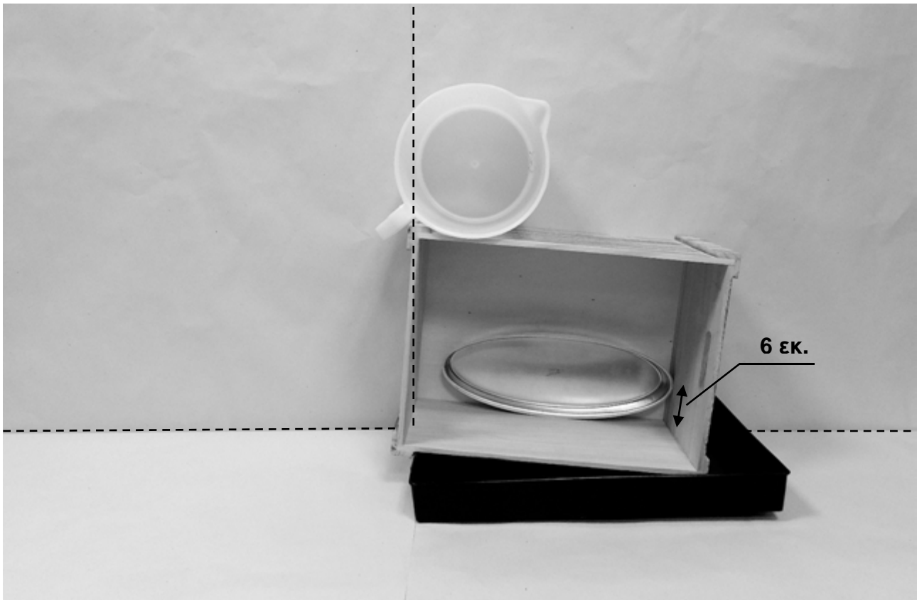
πρώτη φωτογραφία: μπροστινή όψη