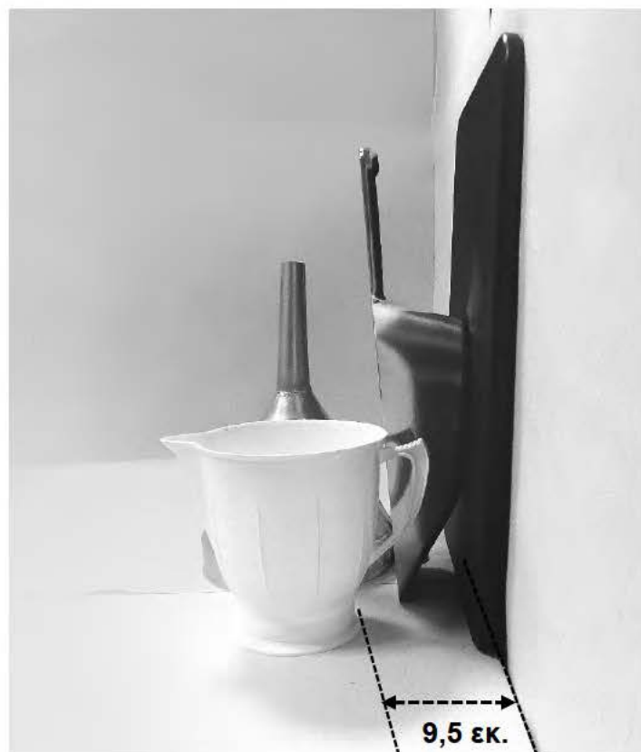
τρίτη φωτογραφία: πλάγια όψη 1