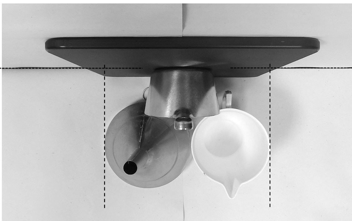
δεύτερη φωτογραφία: κάτωψη