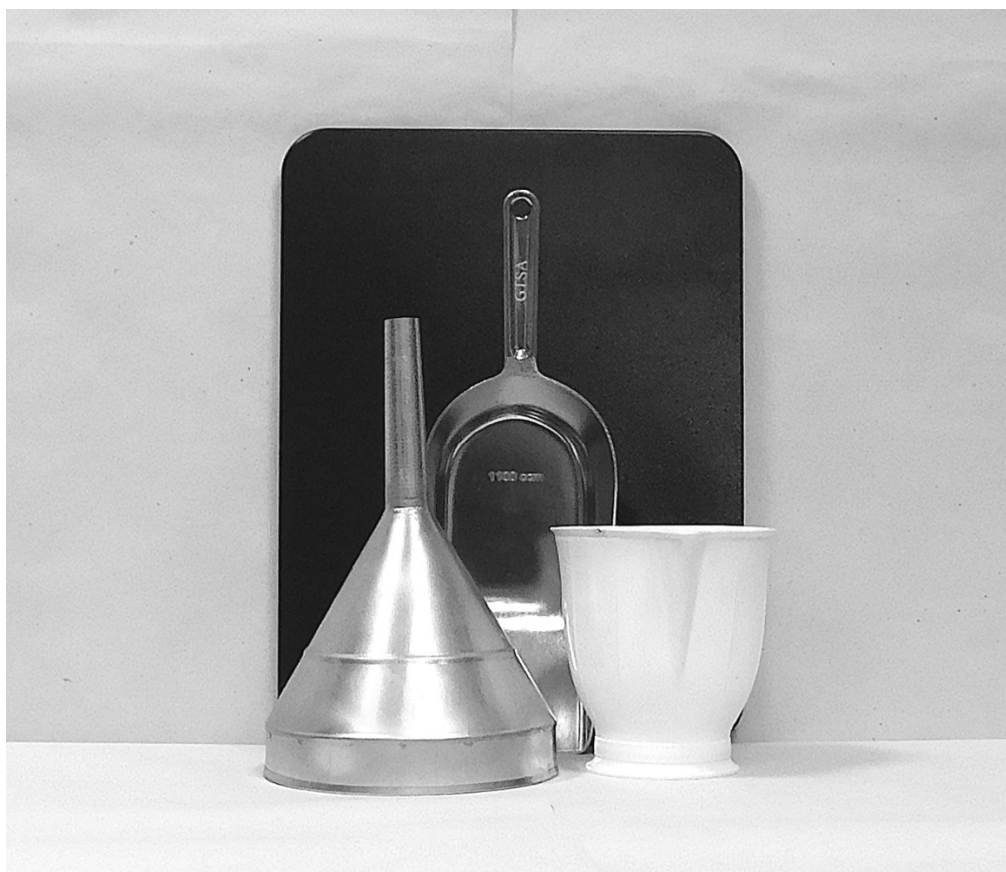
πρώτη φωτογραφία: μπροστινή όψη