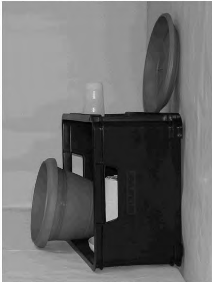
Τρίτη φωτογραφία : Πλάγια όψη