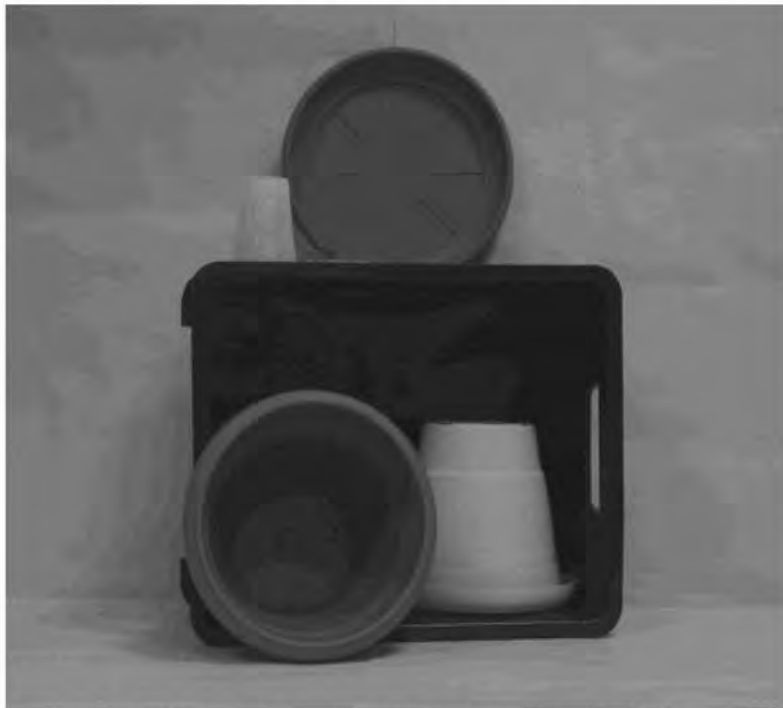
Πρώτη φωτογραφία : Μπροστινή όψη