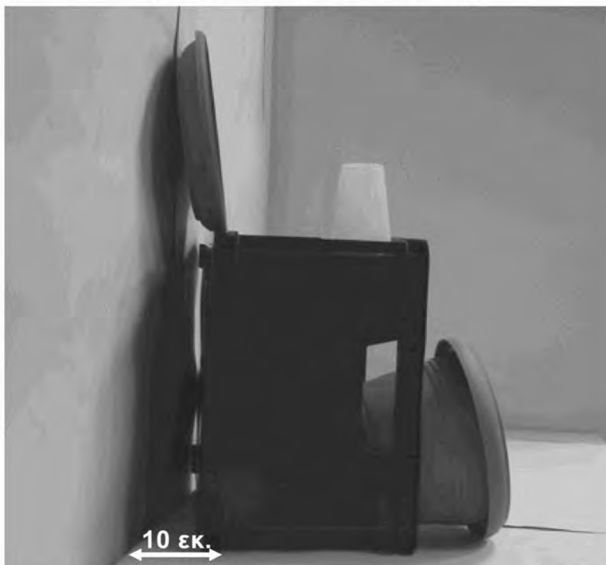
Τέταρτη φωτογραφία : Πλάγια όψη