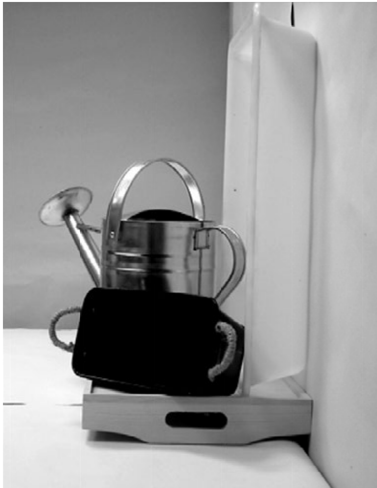
τέταρτη φωτογραφία: πλάγια όψη