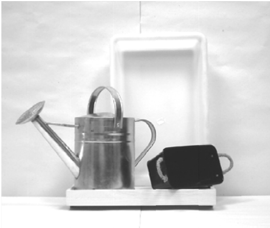
πρώτη φωτογραφία: μπροστινή όψη