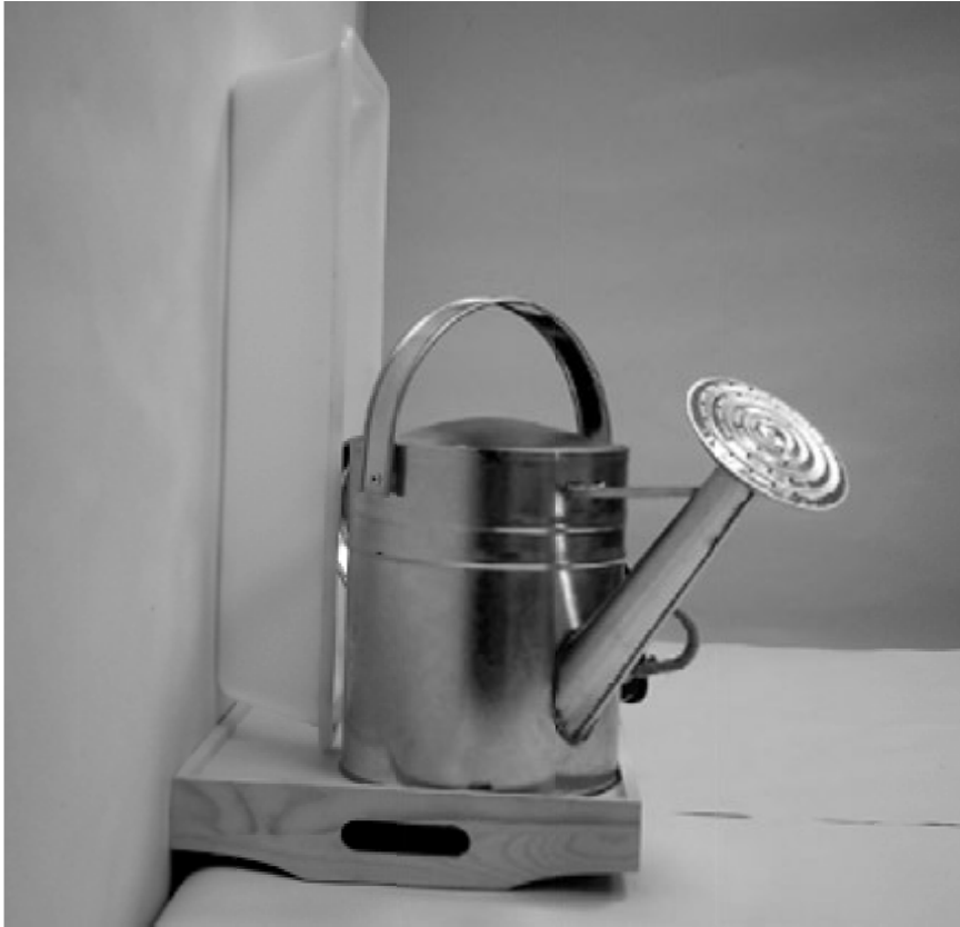
τρίτη φωτογραφία: πλάγια όψη